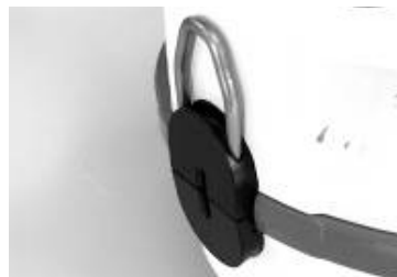
Paso 1: Sacar el pasador