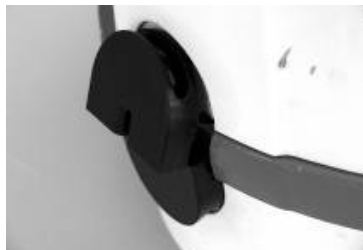
Paso 2: Levantar la mitad superior