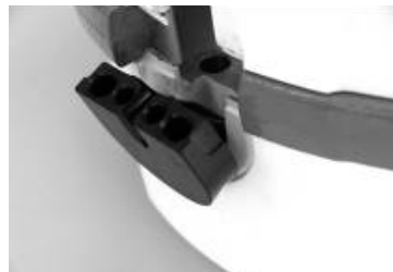
Paso 3: Retirar la mitad inferior