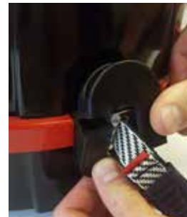
步骤2: 把相连接的管嘴配件分开